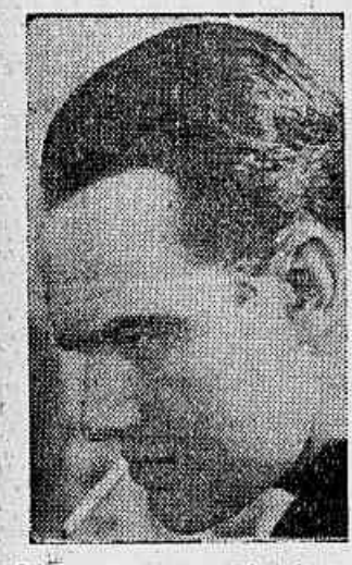
William Haines, em "A toda velocidade", film do Metro